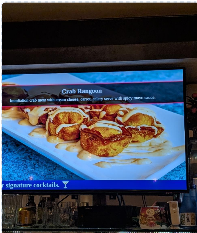
Schöne, klare Layouts.